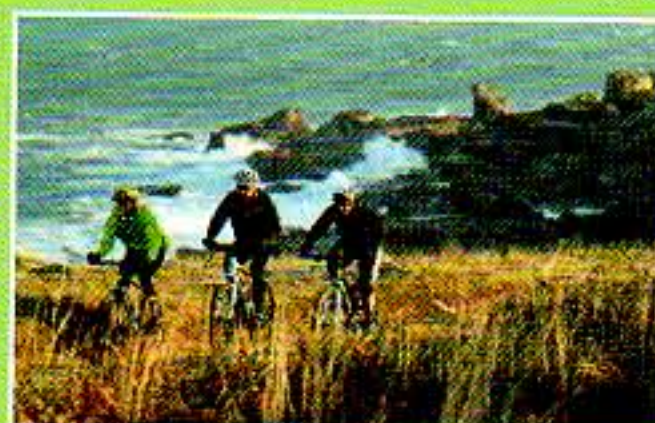
Une sortie entre amis