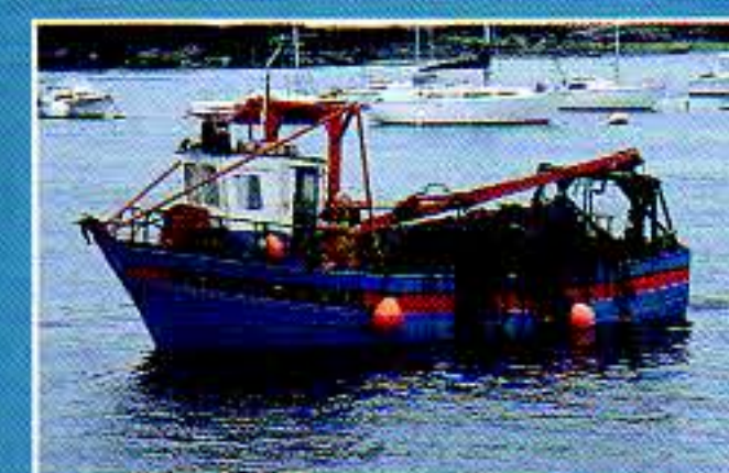
Le charme des ports de pêche