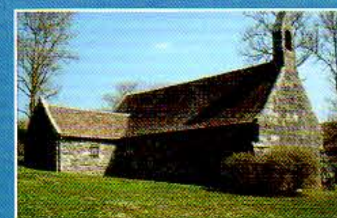
La Chapelle de Loc-Méven à Ploumoguier

15 Urgences médicales 17 Gendarmerie 18/112 Pompiers