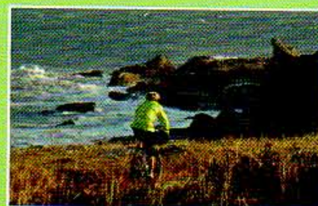
La randonnée découverte