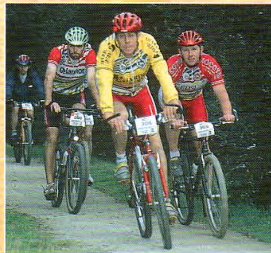
Un parcours sportif et historique

Au cimetière des saints à Lanrivaroé 6 7 , la légende veut que des chrétiens, massacrés par les païens au 5 e siècle, aient été enterrés dans ce lieu.... Pour découvrir la suite de cette légende, rendez vous sur place. Le calvaire du cimetière a été inscrit à l'inventaire supplémentaire des Monuments historiques en 1930.