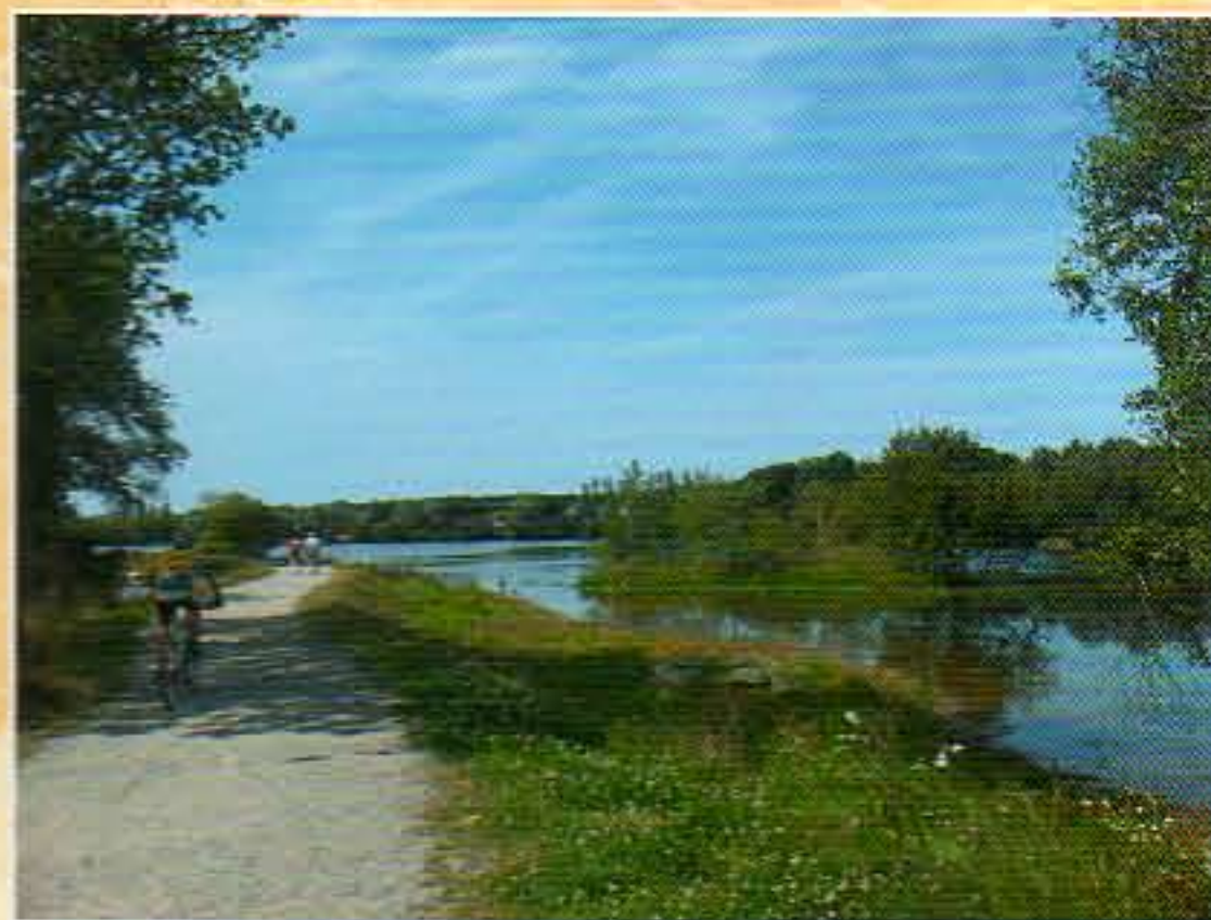
Lac de la Comiren à Saint Renan

Les lacs de Saint Renan 5 6 7 à la fin des années 1950, l'Etat découvre un important gisement de minéral d'étain. Quelques années plus tard, la Compagnie Minière de Saint Renan (COMIREN) démarre les extractions. Son importance a valu à Saint Renan le titre de « Capitale Européenne de l'étain » : 130 personnes en moyenne y travaillaient de jour comme de nuit. Arrêt de l'exploitation en 1975.