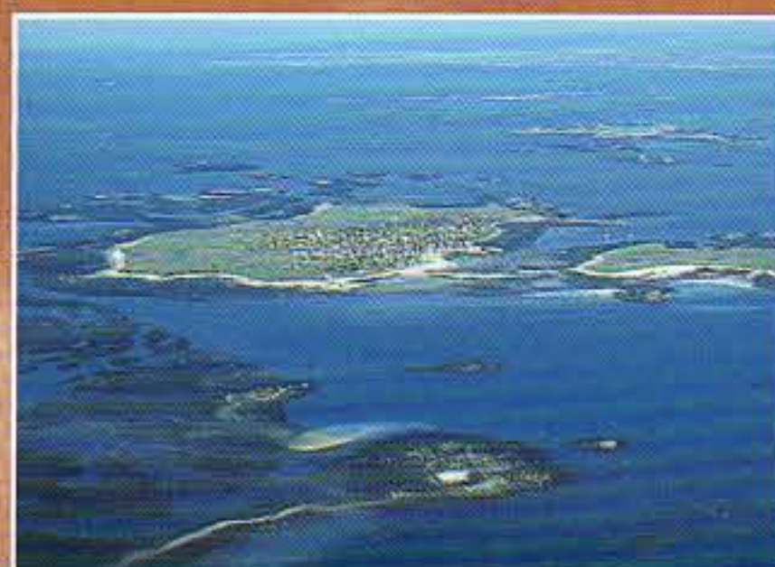
L'archipel de Molène en Mer d'Iroise

La Ria du Poul Conq au Conquet 4 est une basse vallée envahie il y a plusieurs milliers d'années par la mer. A marée basse de vastes vasières (slikke) serpentées par de maigres chenaux se découvrent. Le haut des vasières laisse apparaître des banquettes de végétation formant des prés-salés, encore appelé schorre. Partez à la découverte du Conquet en suivant le parcours "5 siècles de Pierres et de Mer". (renseignement Office de Tourisme)