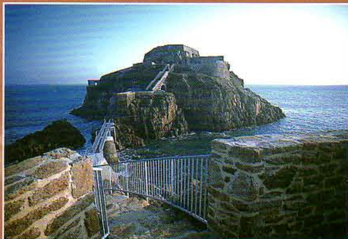
Le Fort de Bertheaume